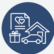
Prijavu imovine i poklona

Direktor Agencije upravlja budžetom i radom Agencije u osam glavnih oblasti, uključujući: