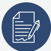
Izveštavanje i statistiku