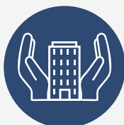
Planove institucion- alnog integriteta