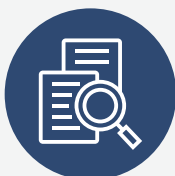
Stratešku politiku i monitoring