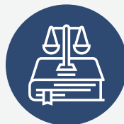
Vlerësimi antikorrupsion i akteve ligjore