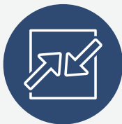
Parandalimi i konfliktit të interesit