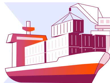
Ақырғы жүк алушылар (теңіз тасымалы)