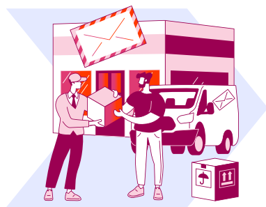
Operadores de servicios postales