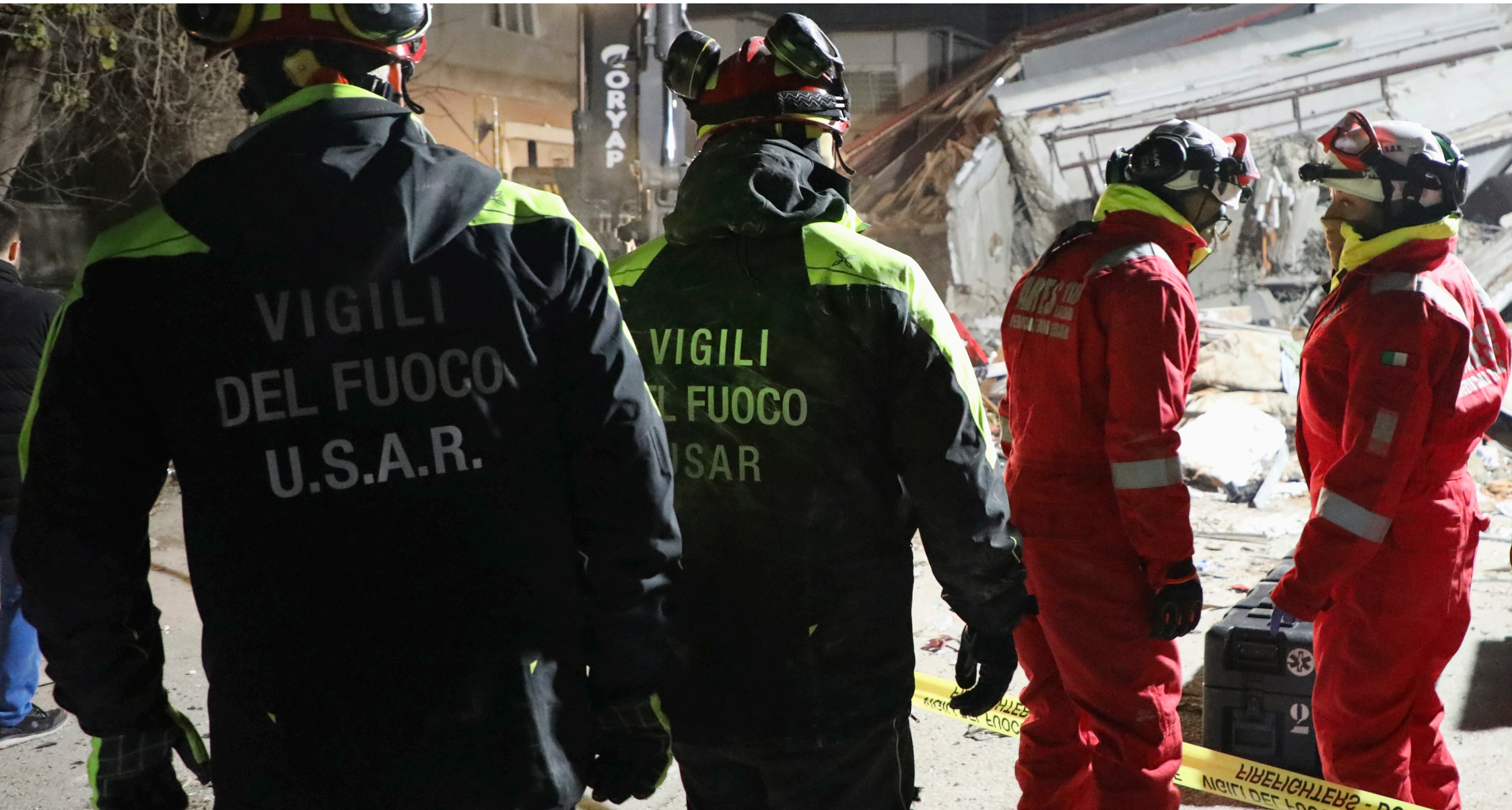
2023, Hatay Italian Search and Rescue Team