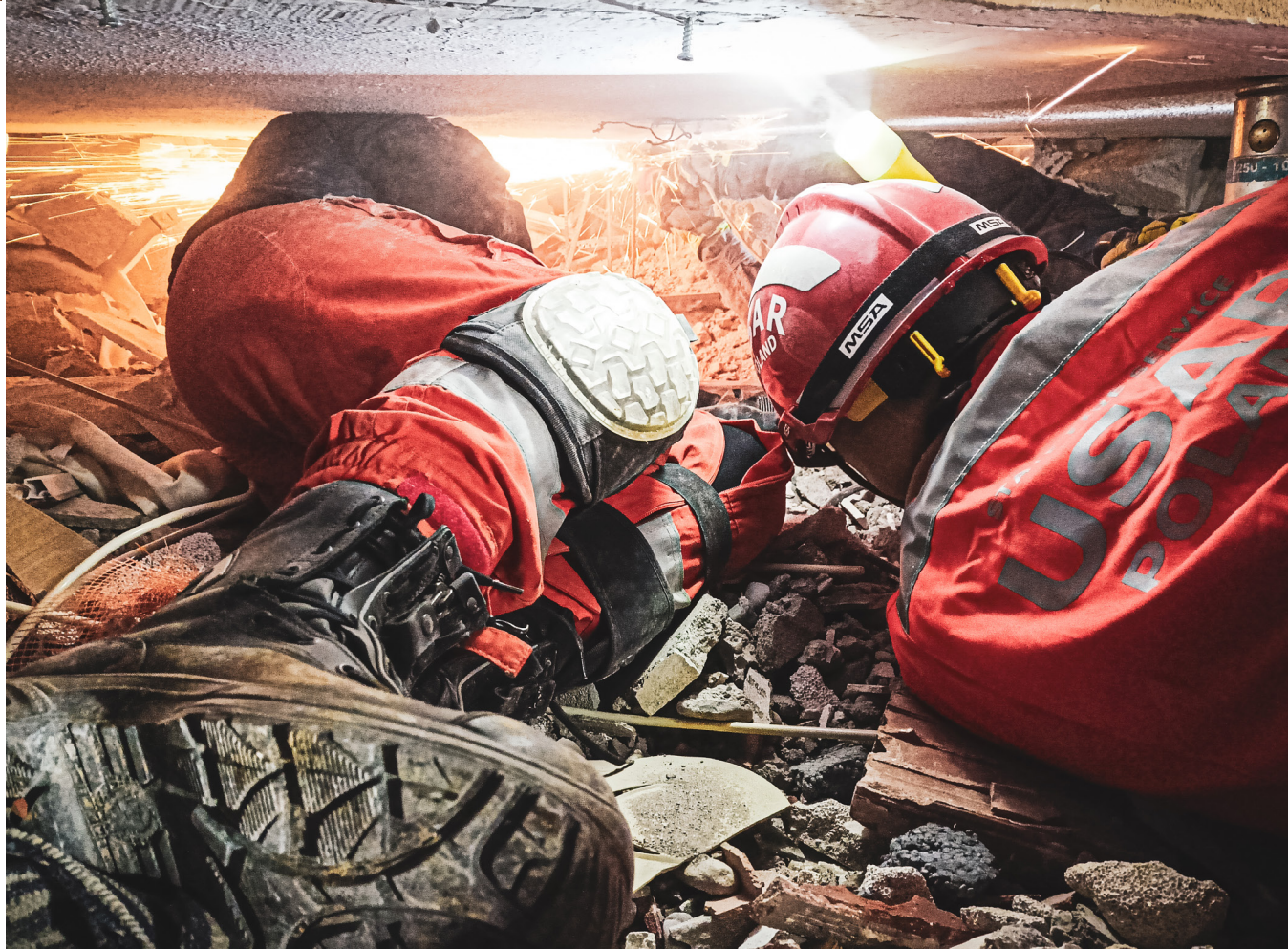
2023, Kahramanmaraş Polish Search and Rescue Team