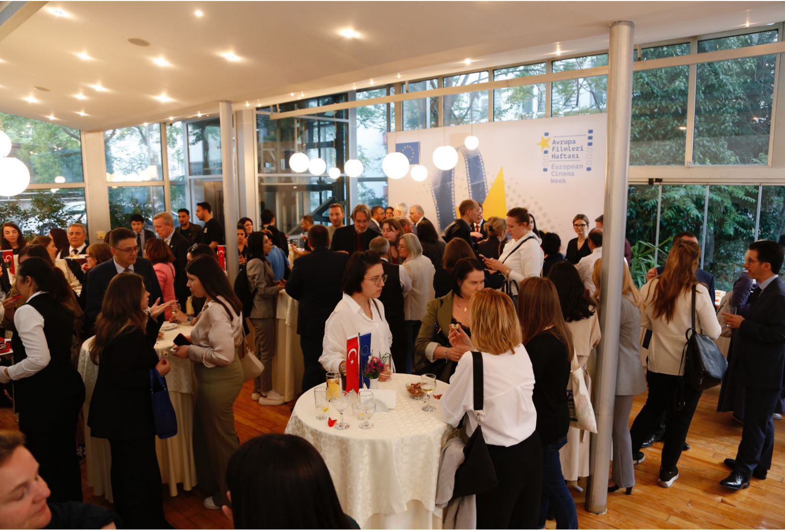
Gala Event of the European Cinema Days in 2023