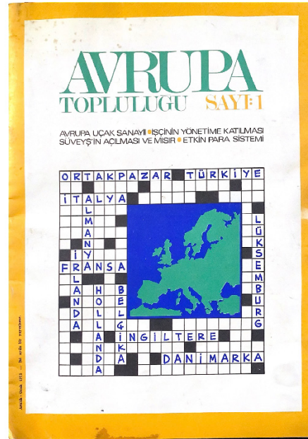
First issue of the European Community magazine