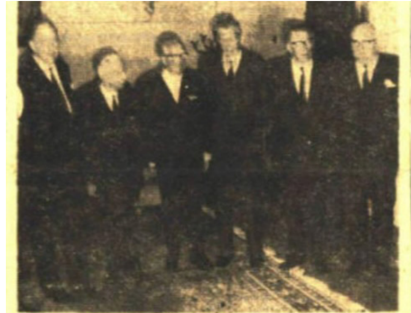
İnönü, Ortak Pazar Bakanları ile