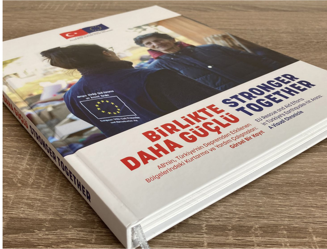
The photo album highlights the remarkable efforts of EU search and rescue teams

The February 2023 earthquakes brought out the best in humanity. Those who participated in the rescue efforts demonstrated extraordinary empathy and solidarity. In addition, brave photographers documented this collective action in the face of tremendous adversity. In February 2024, the Delegation of the European Union to Türkiye published an inspirational photo album: 'Stronger Together: A Visual Chronicle' .