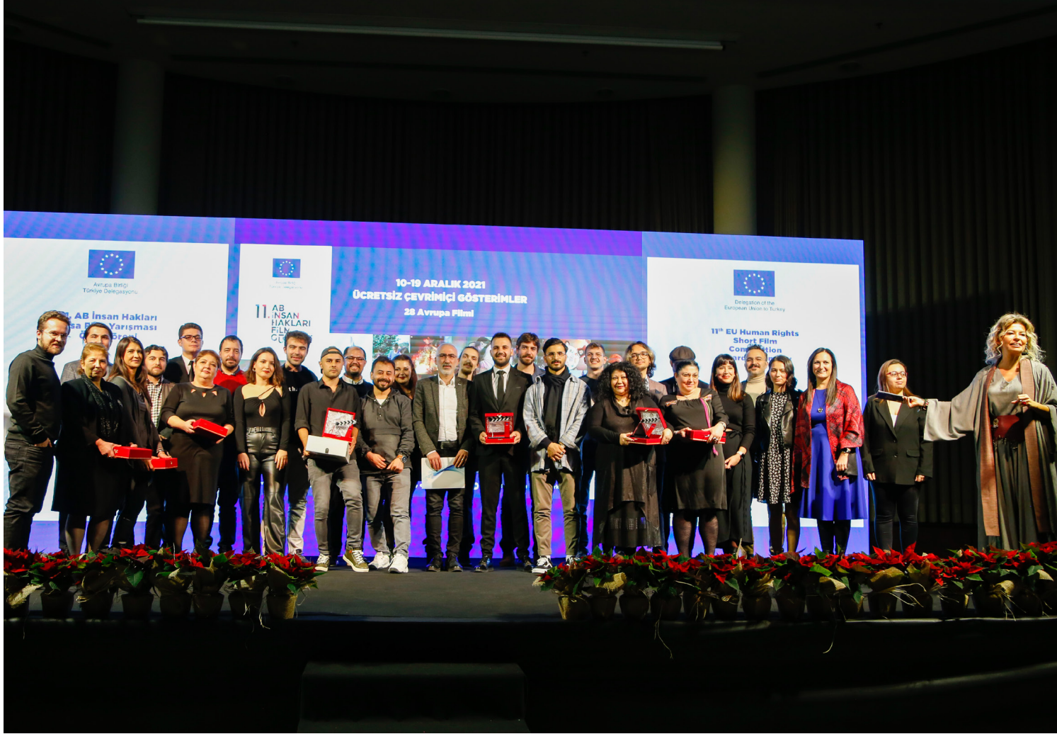
The 11th EU Human Rights Short Film Competition awards ceremony