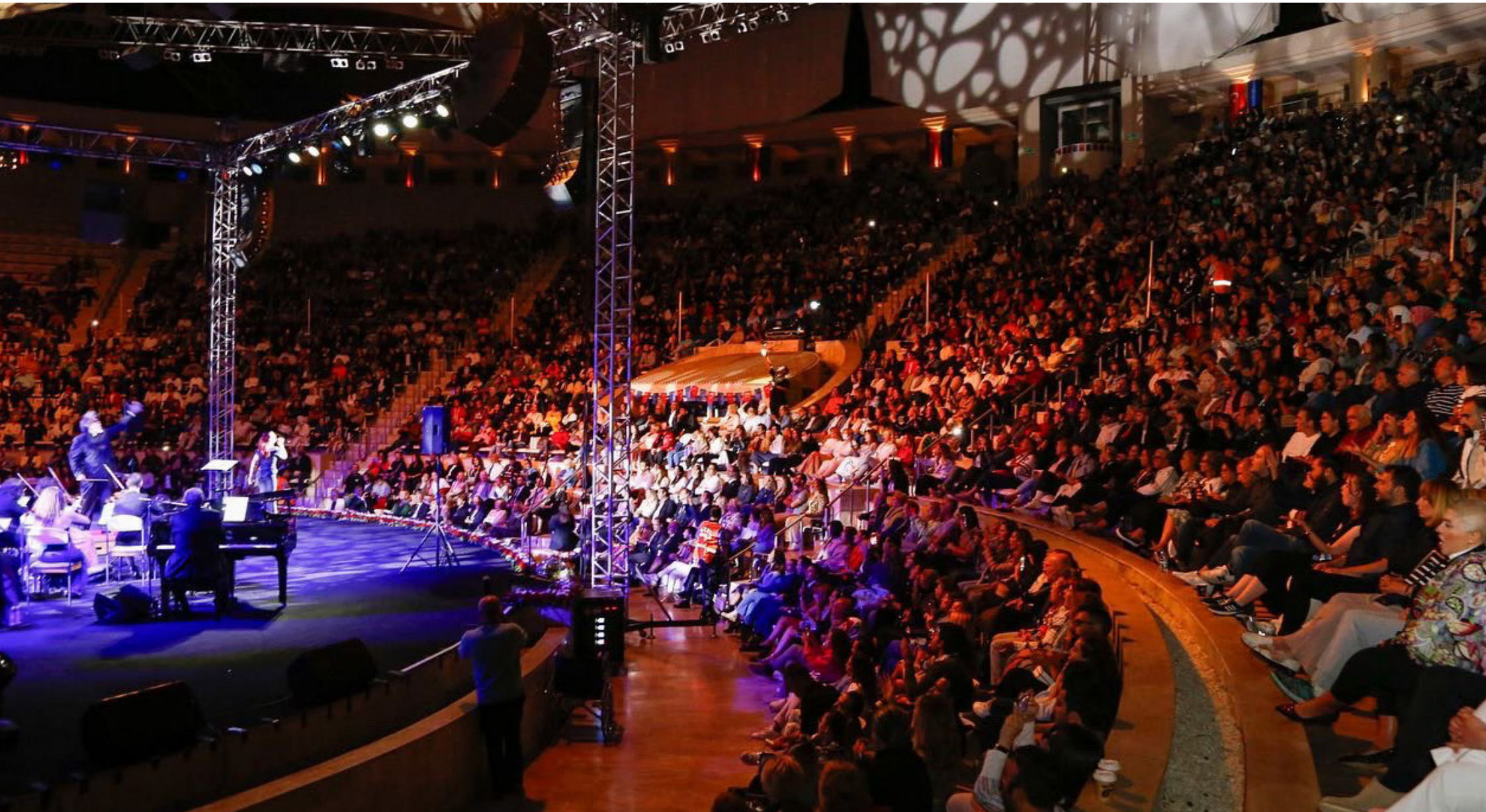
17 September 2023, Bilkent Odeon, the 100th anniversary of the Republic special concert