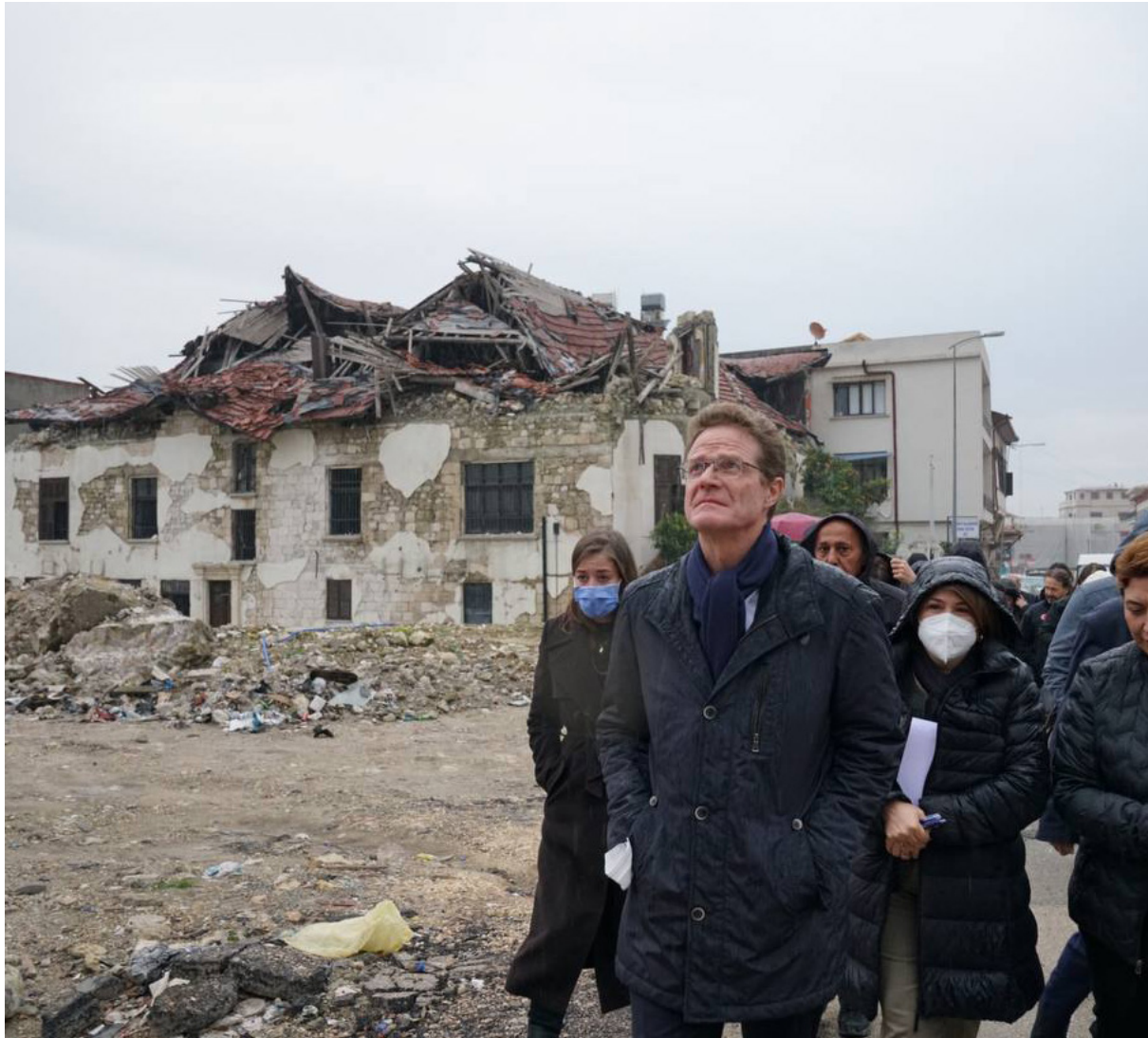
Ambassador Meyer-Landrut visiting Hatay in January 2024

In March 2023 , the European Commission held a Donors' Conference in Brussels titled 'Together for the People in Türkiye and Syria.' At the conference, €6 billion was pledged for the earthquake victims in Türkiye. Among other support, €400 million from the EU Solidarity Fund was mobilised to aid Türkiye. The EU continues to support Türkiye in its reconstruction efforts. European Commissioners, Ambassador Meyer-Landrut and EU Heads of Missions visited the earthquakes area several times.