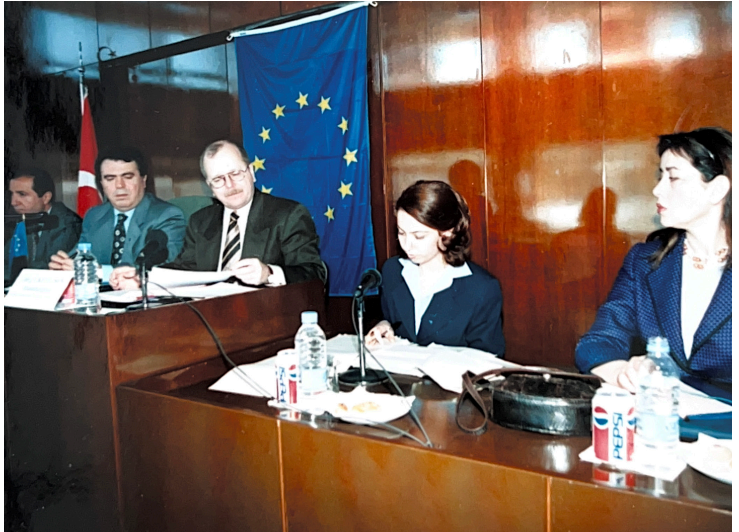
1998, Opening of the EU Information Centre at the Antalya Chamber of Commerce and Industry

In 1995 , work began to establish a network of EU Information Centres in different provinces of Türkiye. In 1996, the first EU Information Centre in Türkiye was established at the Gaziantep Chamber of Commerce. In the same year, EU Information Centres were opened in Diyarbakır, İzmir, and Mersin, and in 1997 in Kayseri, Denizli, Bursa, Trabzon, and Samsun, and in Antalya in 1998. EU Information Centres currently serve as reliable sources of EU-related information in 19 provinces of Türkiye.