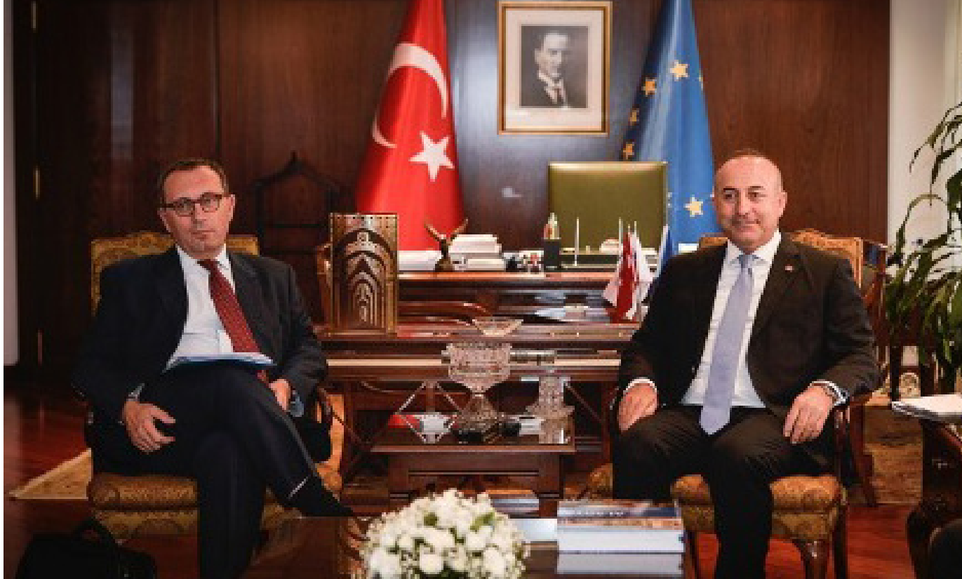
2014, Ambassador Stefano Manservigi and then Foreign Minister Mevlüt Çavuşođlu