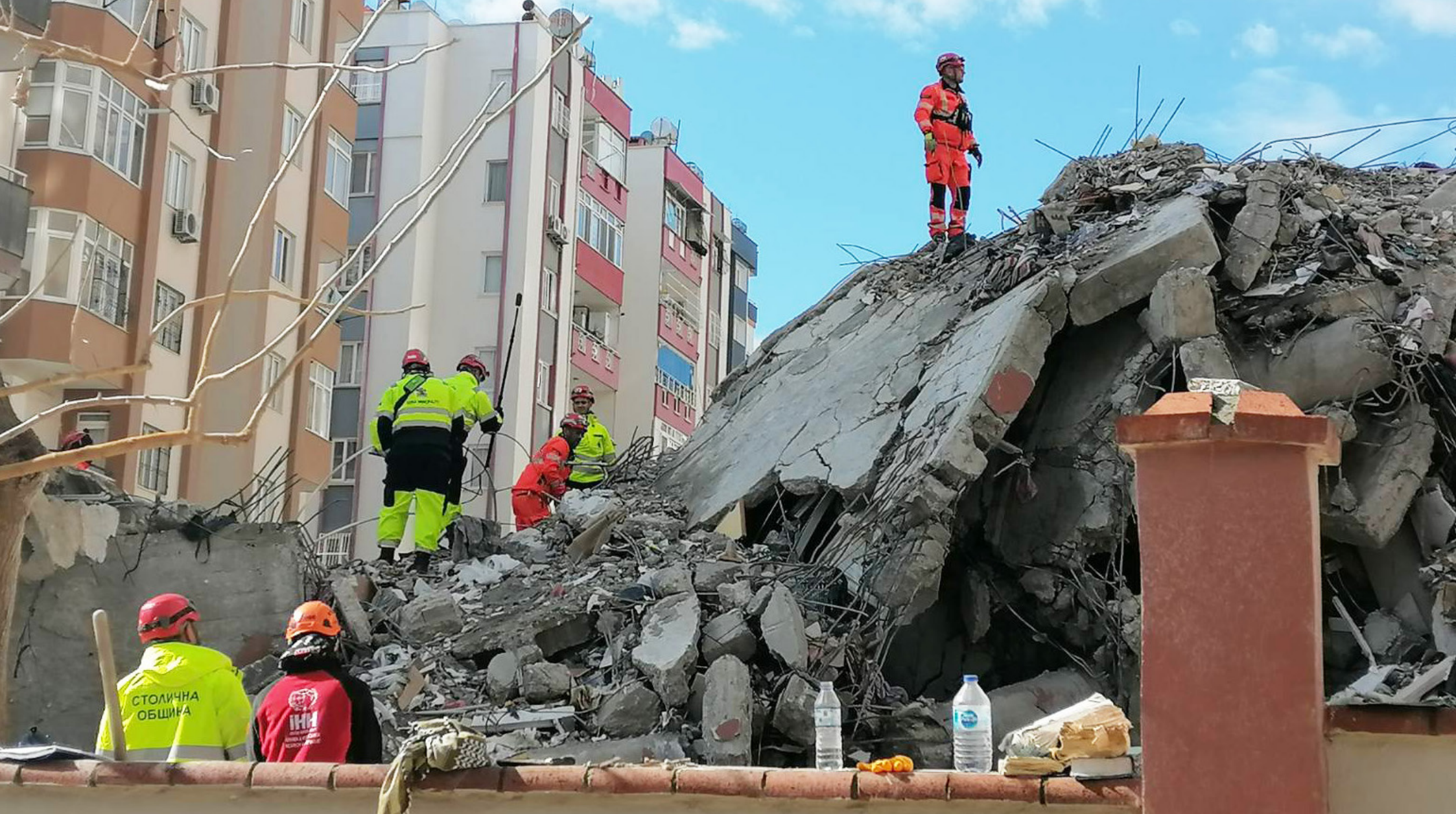
2023, Adana Bulgarian Search and Rescue Team