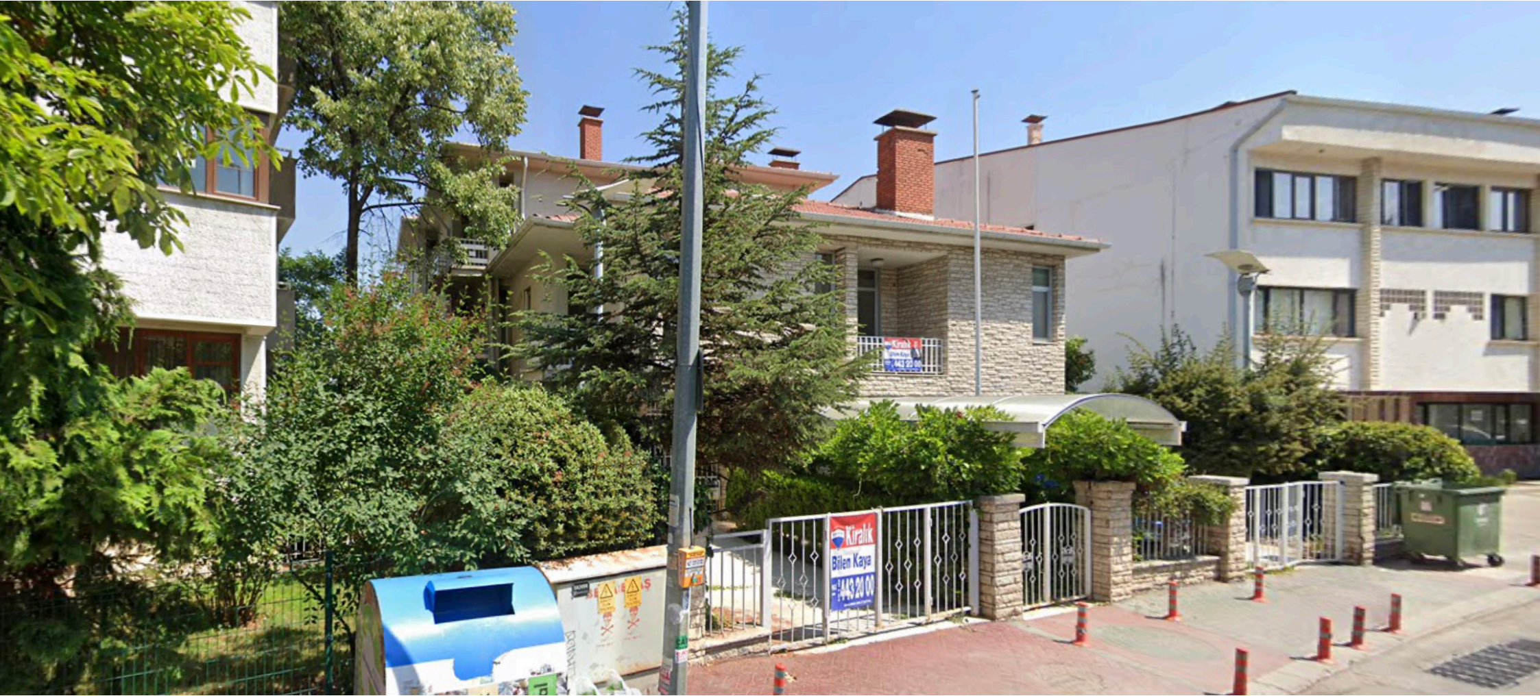
Kuleli Sokak, No:15, Çankaya

As a larger office was needed, the Office moved to a building on Kuleli Sokak with a substantial garden. The official opening was held on 25 June 1983.