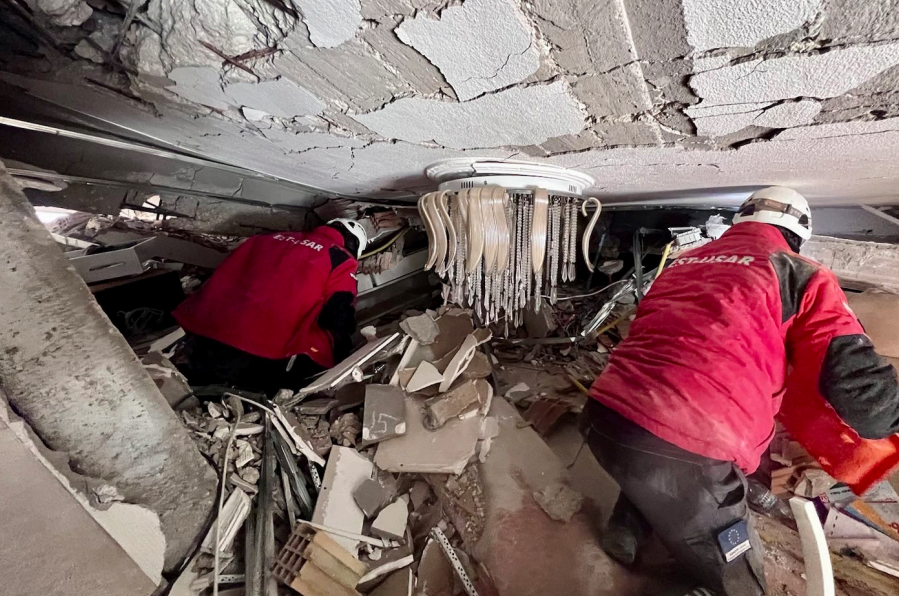
2023, Hatay Estonian Search and Rescue Team