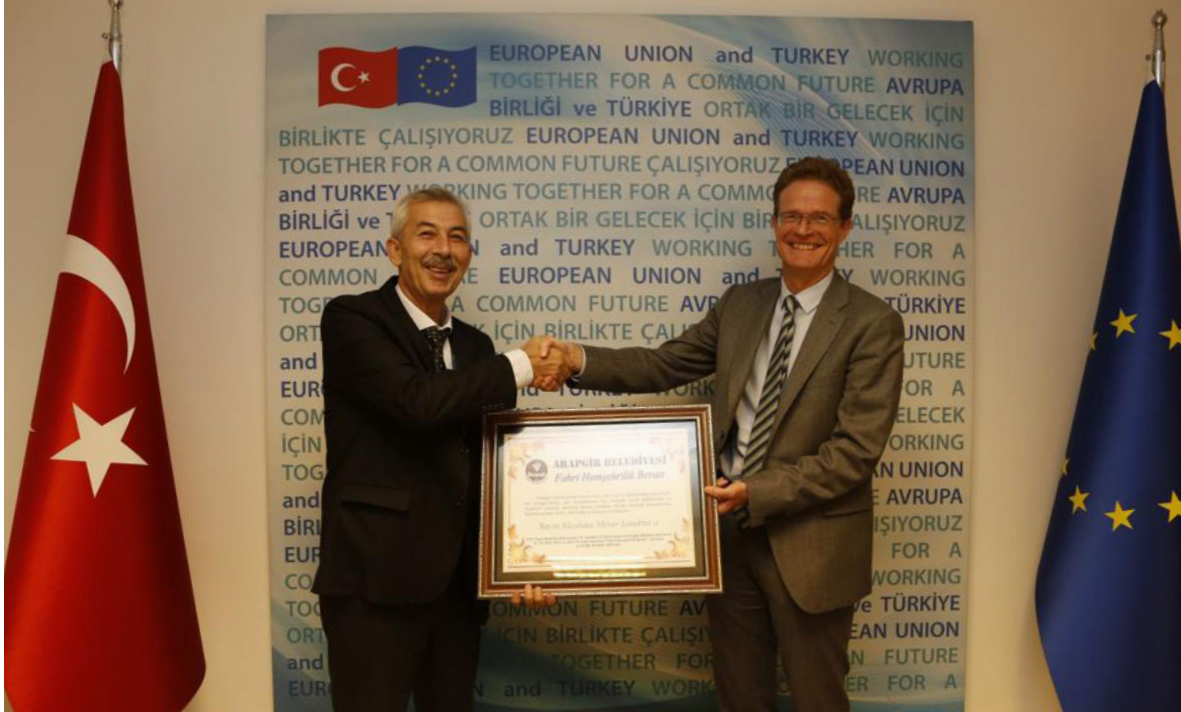
2021, The Mayor of Arapgir, Haluk Cömertoğlu, presenting Ambassador Meyer-Landrut with the honorary citizenship certificate

In 2021 , the European Council expressed the EU's readiness to engage with Türkiye focussing on a positive agenda in a phased, proportionate, and reversible manner to enhance cooperation in several areas of common interest.