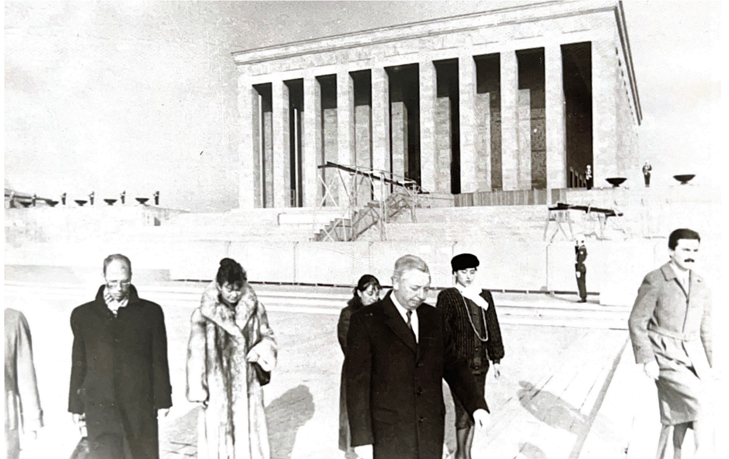
1987, Farewell visit of European Community Representative Gwyn Morgan to Anıtkabir

In 1987 , Gwyn Morgan left Türkiye, and Jan van Rij was appointed European Community Representative. 1987 was also a significant year in terms of European representation in Türkiye. With the signing of an agreement between the Commission of the European Communities and the Republic of Turkey, the Press and Information Office acquired diplomatic status. It was subsequently renamed the Representation of the European Commission to Turkey. This decision was published in the Official Gazette on 4 June 1987. From then on, leaders of the European Commission Representation would bear the title of Ambassador.