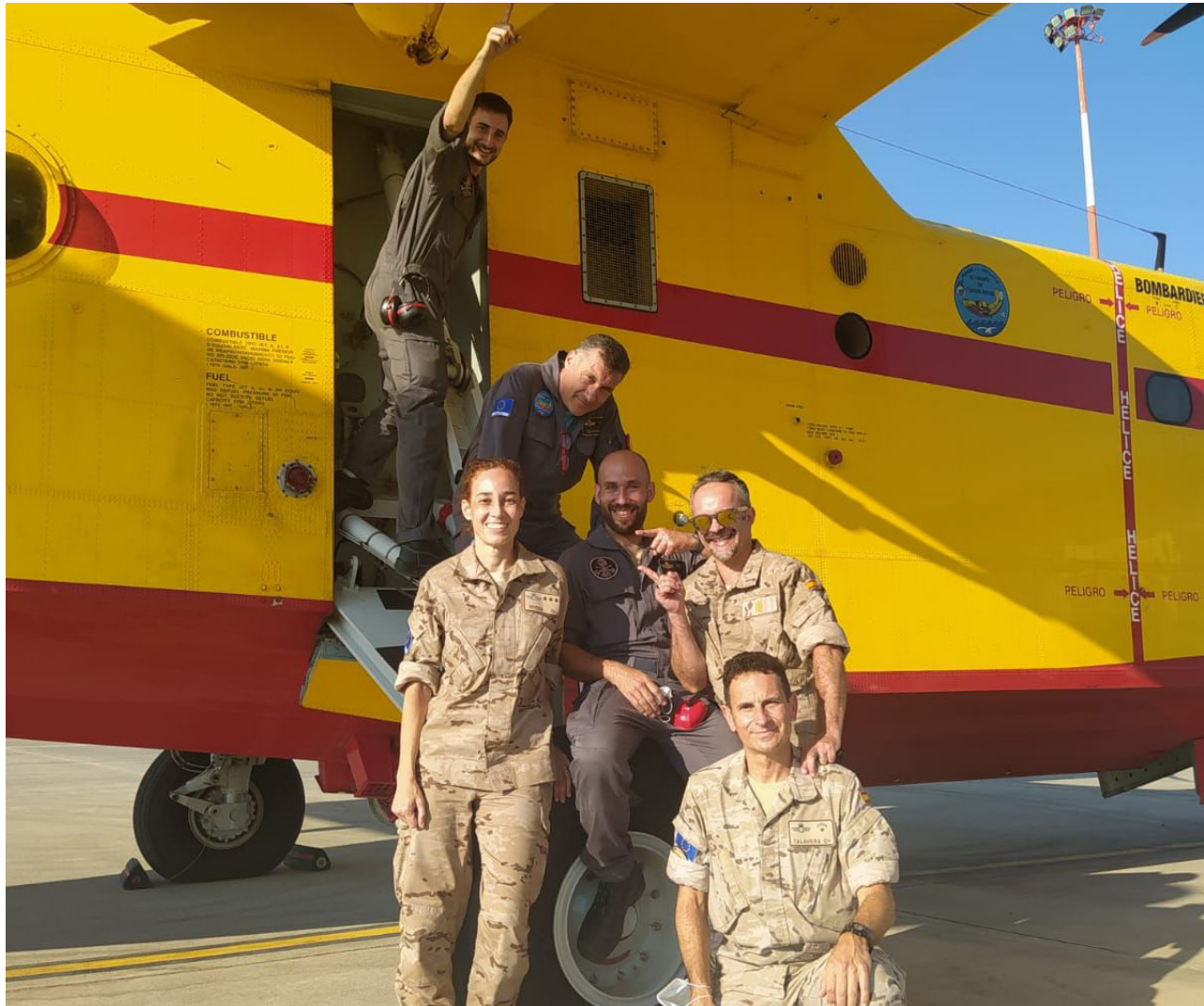
EU teams responded to forest fires in Antalya

The EU's Humanitarian Aid department responded to the following emergencies: the major Marmara earthquake in 1999, the floods in the southeast in 2006, the Van earthquakes in 2011, the forest fires in Mugla and Antalya in the summer of 2021, and the earthquakes of February 2023.