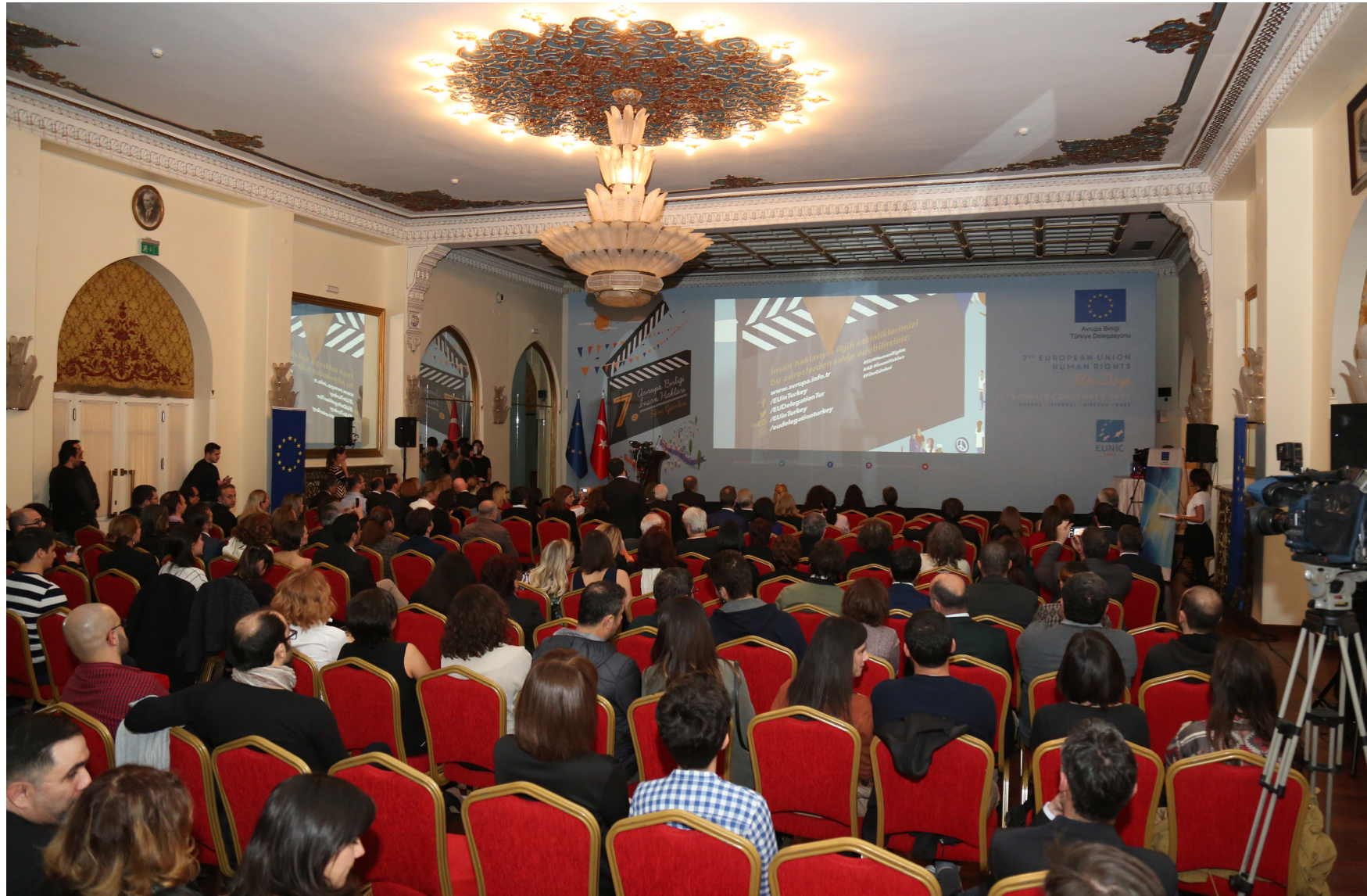
The 7th EU Human Rights Short Film Competition's Award Ceremony