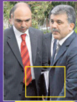
Dışişleri Bakanı Gül ve AB Genel Müdürü Straw, Müzakere Çerçeve Belgesi kursamışlardı.

İşte Müzakere Çerçeve Belgesi iki önemli değişiklik