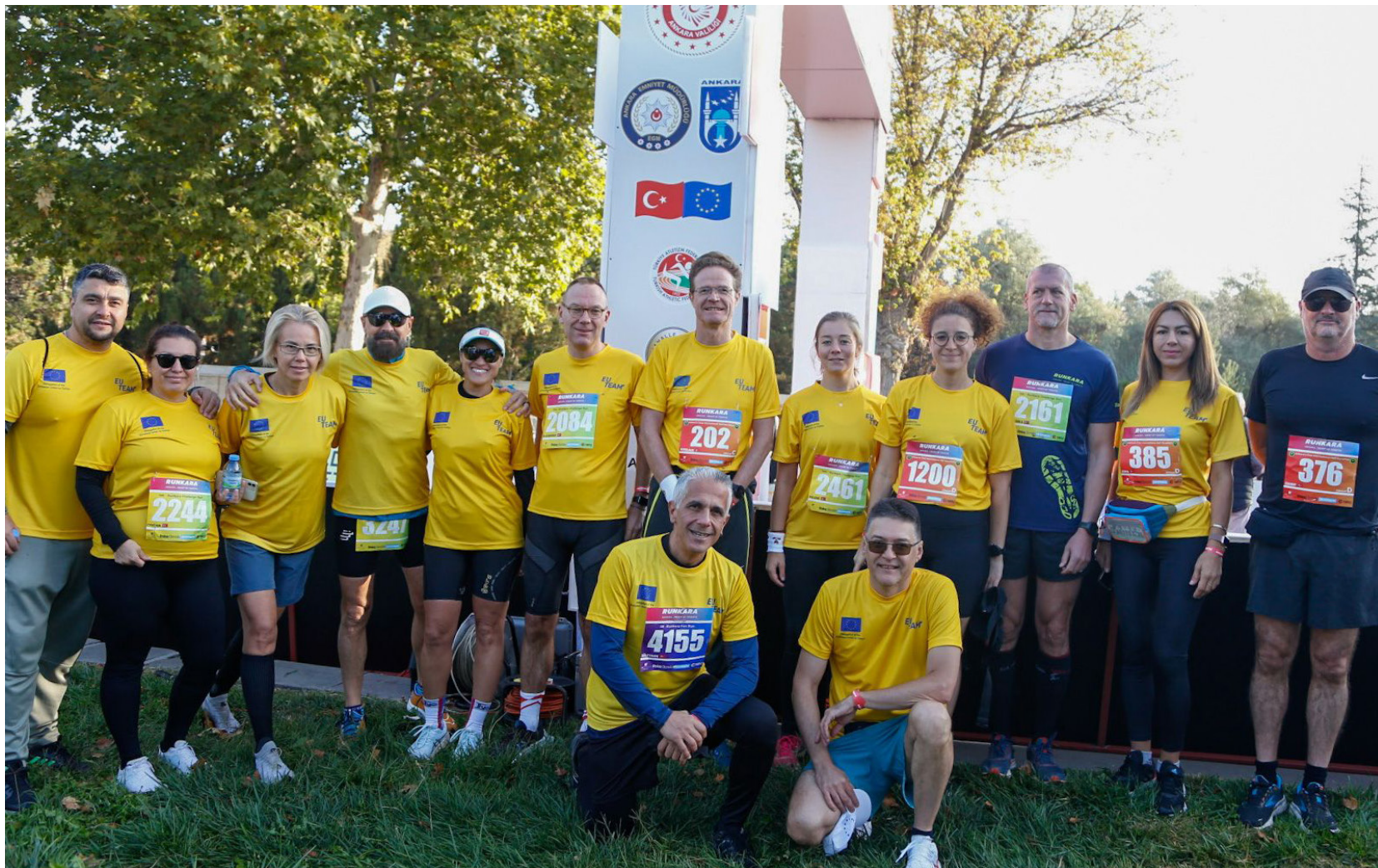
A group of Team Europe athletes at the starting point of Runkara