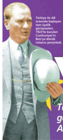
Türkiye ile AB arasında başlayan tam üyelik görüşmeleri, 1923'te kurulan Cumhuriyet'in batıya dönük rotasını perçinledi.