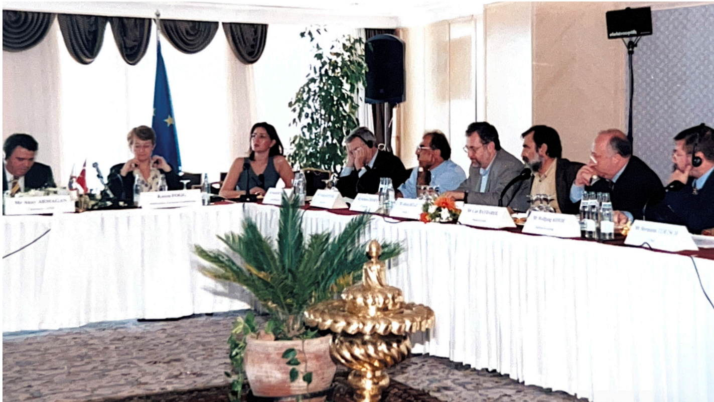
1998, EU-Turkey Conference of Journalists in Antalya