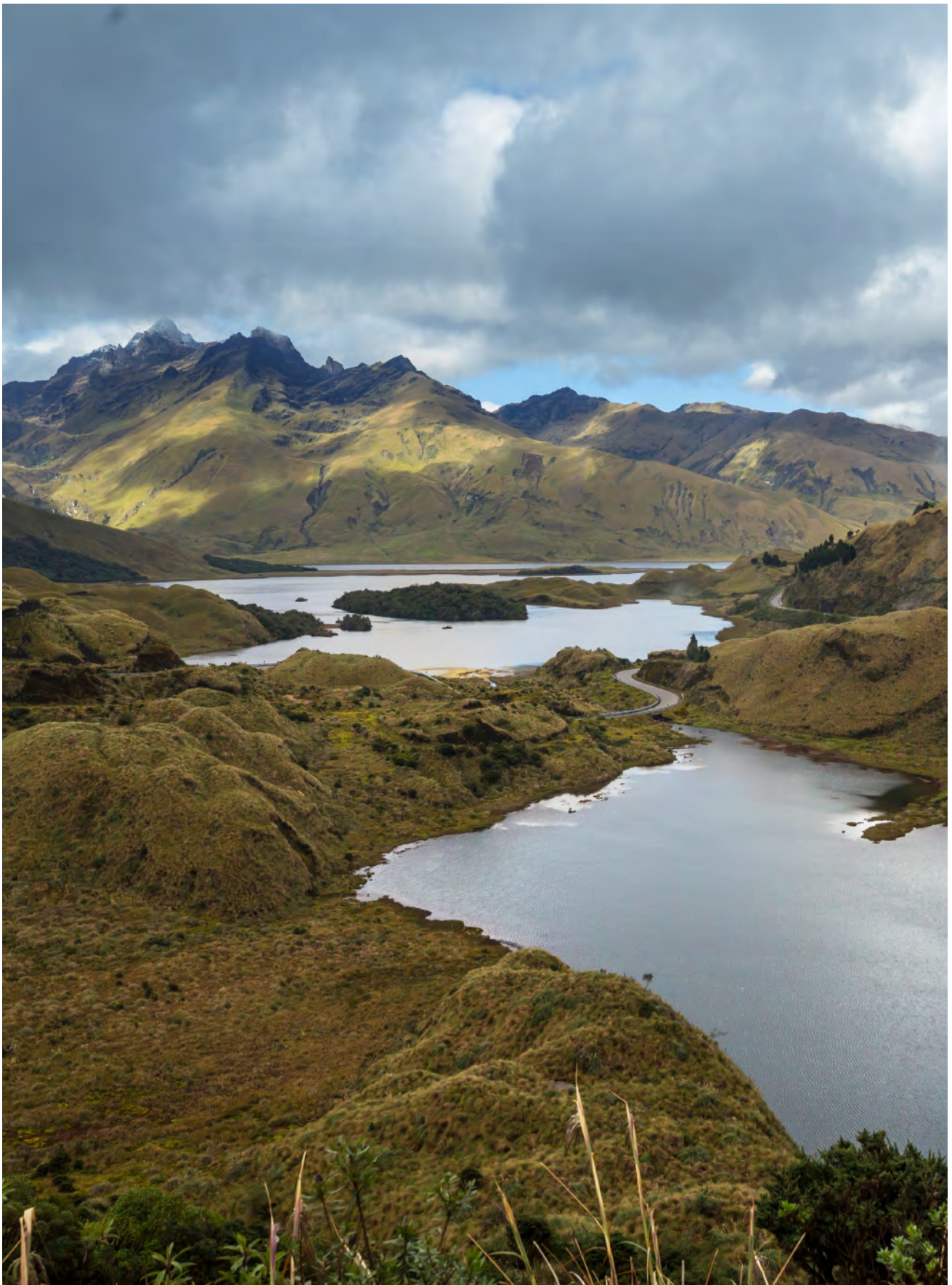
Lagunas de Atillo - Parque Nacional Sangay Chimborazo - Riobamba Ecuador